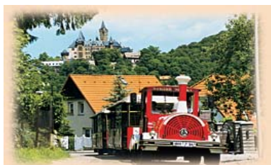
Die Wernigeröder Bimmelbahn auf Tour

Im Frühjahr diesen Jahres hat es der SPD-Ortsverein Wernigerode einer guten Tradition folgend erneut ermöglicht, dass vierzehnmal Seniorinnen und Senioren mit der Wernigeröder Bimmelbahn eine Stadtrundfahrt unternehmen konnten. Pro Fahrt nahmen etwa 35-40 ältere Bürgerinnen und Bürger auch aus den Ortsteilen die Gelegenheit wahr, auf diesem Weg Neues in unserer Stadt zu besichtigen aber auch Altbekanntes wieder zu entdecken.